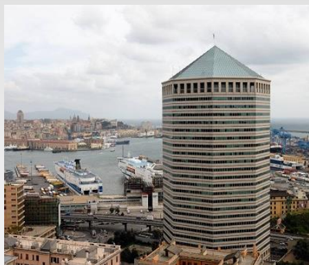
Edificio Torre Nord di Genova detto Matitone

La professionalità di Benpower nella bonifica dell'edificio ha permesso il riutilizzo di buona parte della struttura già dopo una settimana dal sinistro.