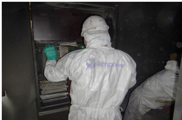
Bonifica materiale cartaceo

Venerdì 19 dicembre sono iniziati i lavori con 14 tecnici specializzati. Le prime attività di Benpower si sono concentrate ai piani 12° e 13°, provvedendo ad aspirare i fumi, decontaminare manualmente il fabbricato, gli arredi e i dossier cartacei, oltre a sanificare l'aria mediante trattamenti ozonizzanti.