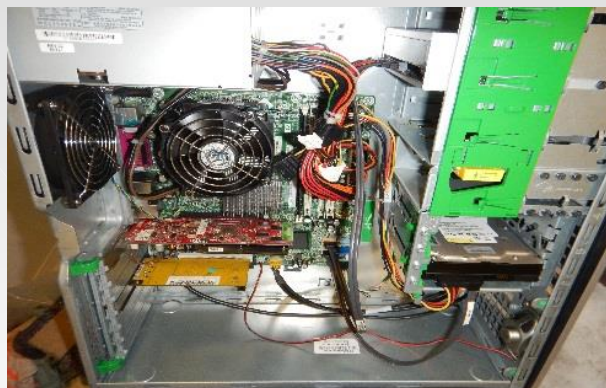
Bonifica apparecchi elettronici

I tecnici Benpower hanno effettuato il sopralluogo presso i locali incendiati assieme ai dirigenti dello stabile e ai periti incaricati dalle Compagnie assicurative e dalla proprietà, il giorno giovedì 18 dicembre 2014. Appurati i danni e l'urgenza di dare avvio alle operazioni di bonifica per limitare i danni e consentire la ripresa delle normali attività lavorative in piena sicurezza, Benpower è stata incaricata già nel tardo pomeriggio del giorno stesso.